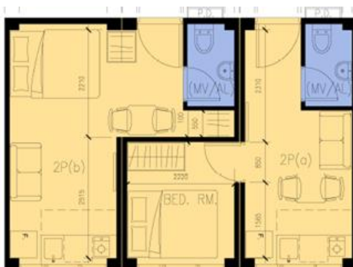
二人單位 (不包括傢俱)