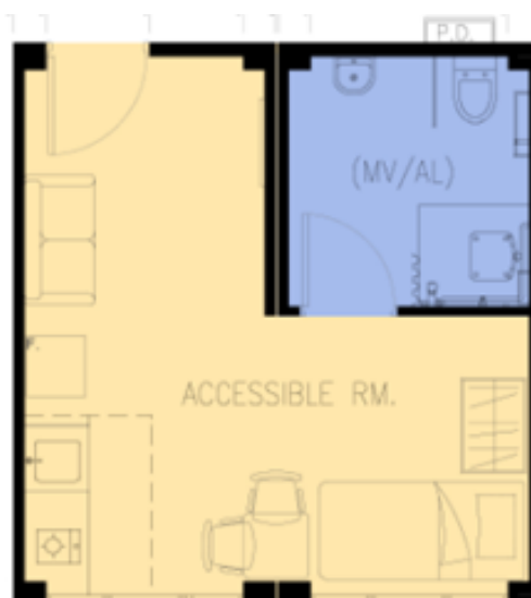
無障礙單位 (不包括傢俱)