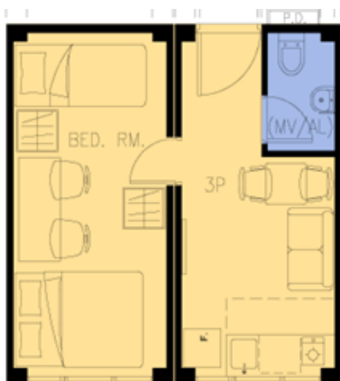
三人單位 (不包括傢俱)