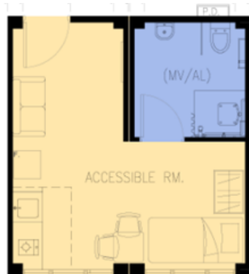
無障礙單位 (不包括傢俱) 已滿額 (暫不接受申請)