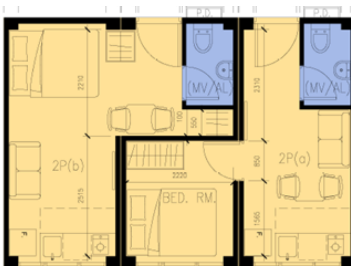
二人單位 (不包括傢俱)